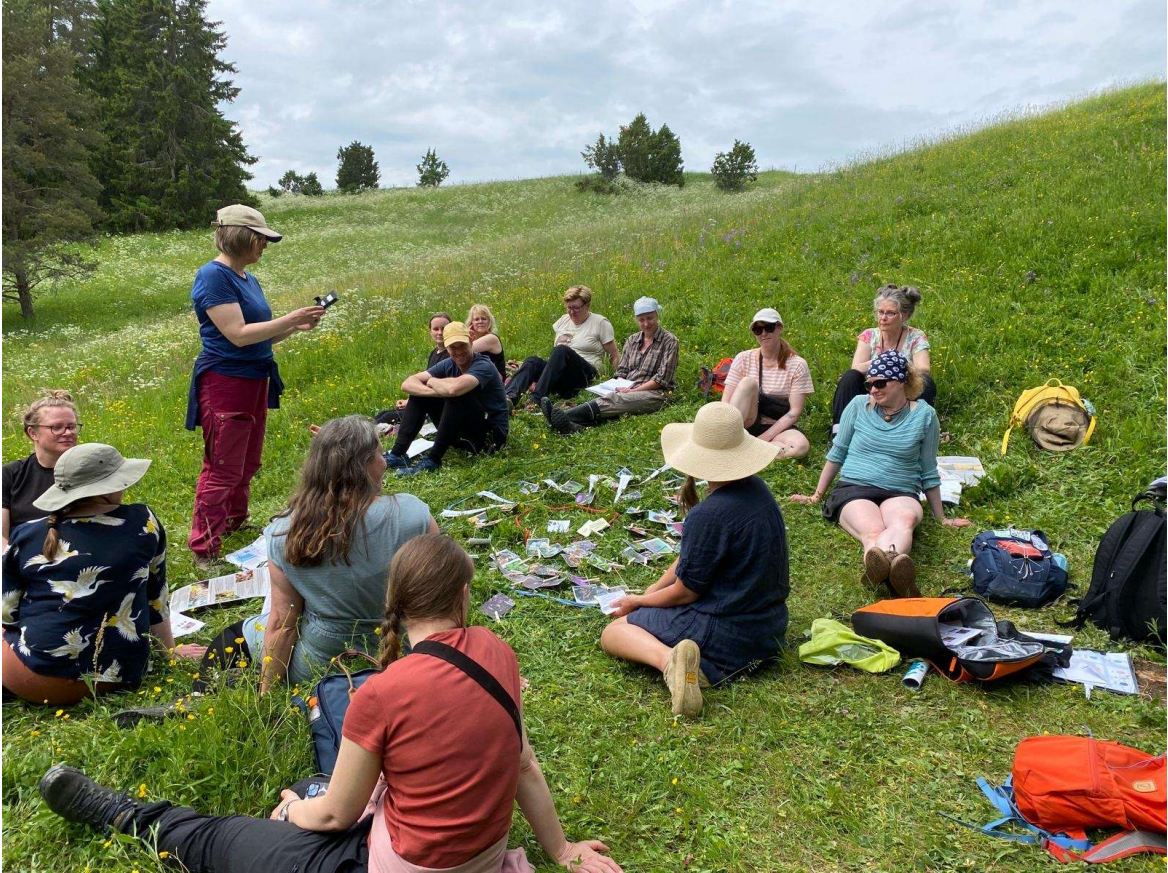
Pölyttäjät viestintuojina -hankkeen pölyttäjä- ja kasviretki Someron Häntälän notkoilla kesäkuu 2025. Työpajatyöskentelyä ekosysteemi-verkon ympärillä.