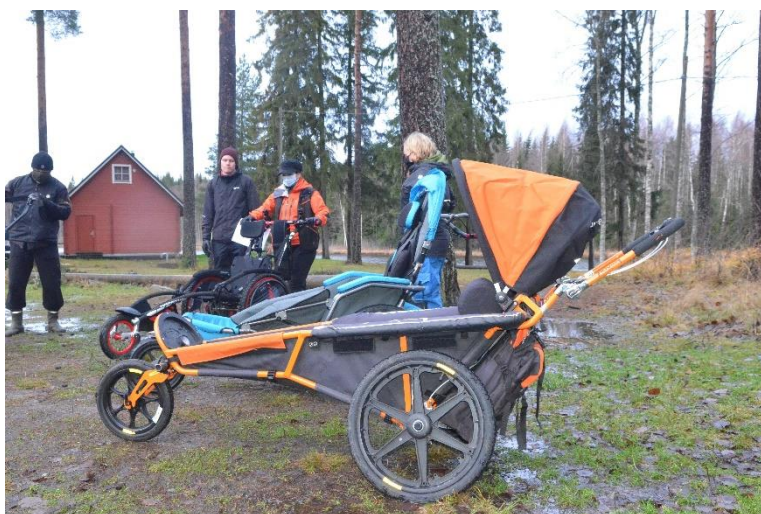
Syksyn LYKE-tapaaminen MALIKEn liikkumisenapuvälineiden parissa

Seuraavassa esitellään vuoden 2020 toiminnan toteutus, tulokset ja arviointi tarkemmin, painopistealueet ensin. Tuloksia arvioitaessa ja toimintasuunnitelman tavoitteisiin verrattaessa on huomioitava, että liitto sai rahoitusta huomattavasti haettua vähemmän, ja että koronapandemia vaikutti tilaisuuksien kuten messujen määrään.