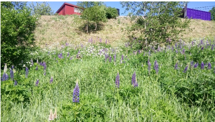
Kesäkuun komealupiinikasvustoa ja koiranputkipitsiä /JS

- Komealupiini on tuotu rehuksviksi ja myös karannut puutarhoista. Se on määritelty kansallisesti haitalliseksi vieraslajiksi. Lupiini on toki kaunis kukkiessaan, mutta hyvin hankala hävitettävä ja siksi se on uhka luonnon monimuotoisuudelle (biodiversiteetille).