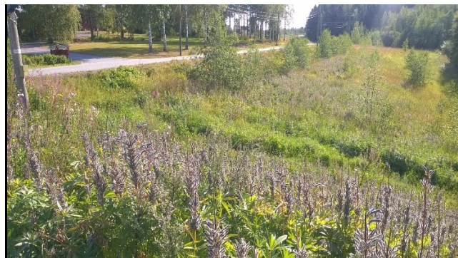
Lupiini on hernekasvi. Siemenpankki säilyy pitkään maaperässä./AV

Suomessa kasvavaa komealupiinia ei voi syödä, sillä se on lievästi myrkyllinen. Ranskassa viljellään syötäväksi kelpaavaa makealupiinia. Makealupiinijauholla voi korvata kananmunan, joten kasvisruokailijat suosivat sitä.