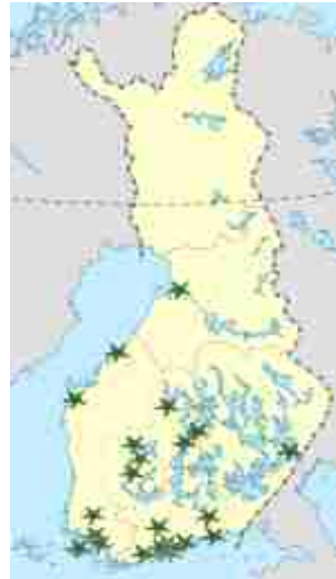
Suomessa on 25 luonto- ja ympäristökoulua