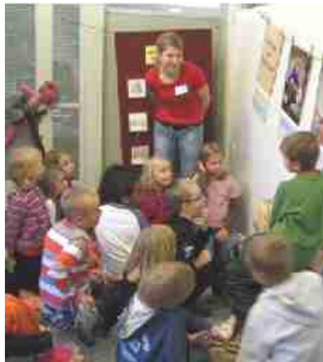
Ympäristökouluissa opitaan toiminnallisesti.