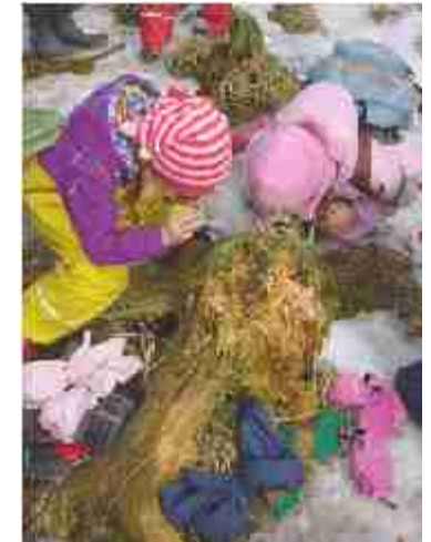
Luontokouluissa ekosysteemi tulee tutuksi.